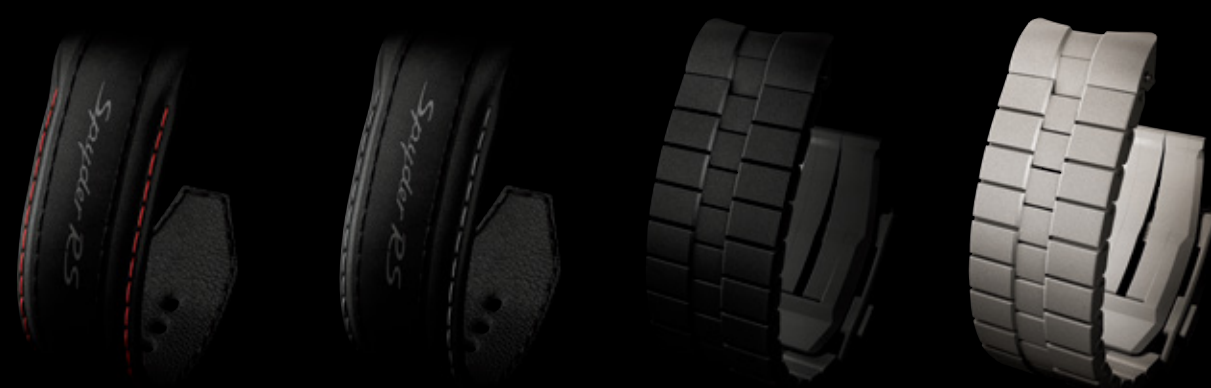
Leder schwarz, Ziernaht kaminrot