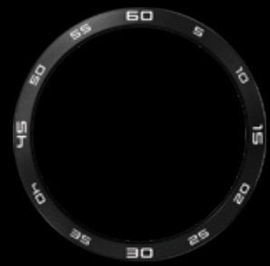
Titan schwarz, Tachymeter