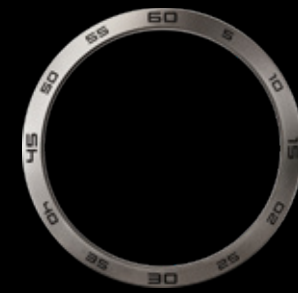
Titan natur, Tachymeter