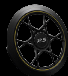
Schwarz mit Farbring in Racinggelb