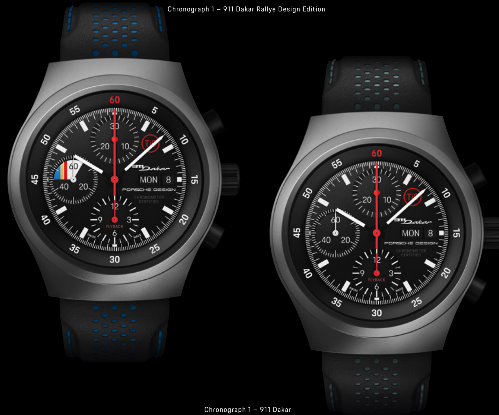
Chronograph 1 – 911 Dakar