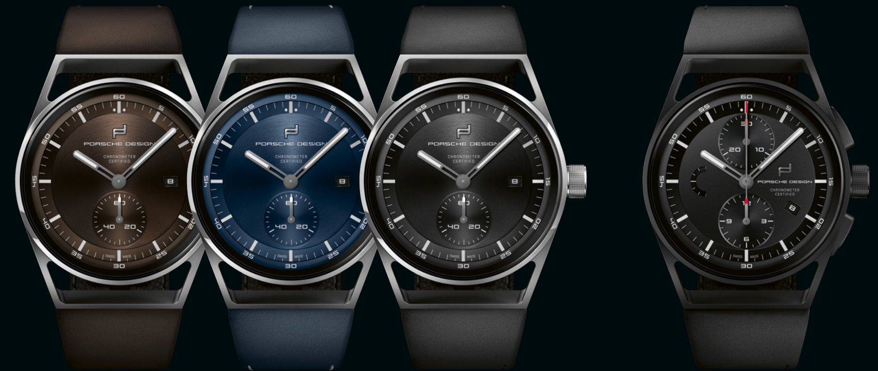
SPORT CHRONO SUBSECOND TITANIUM & BROWN

Pour la toute première fois dans l'histoire de Porsche Design, la Sport Chrono Collection propose un chronographe en deux tailles différentes : outre la version bien connue de 42 mm, il est également disponible en 39 mm.