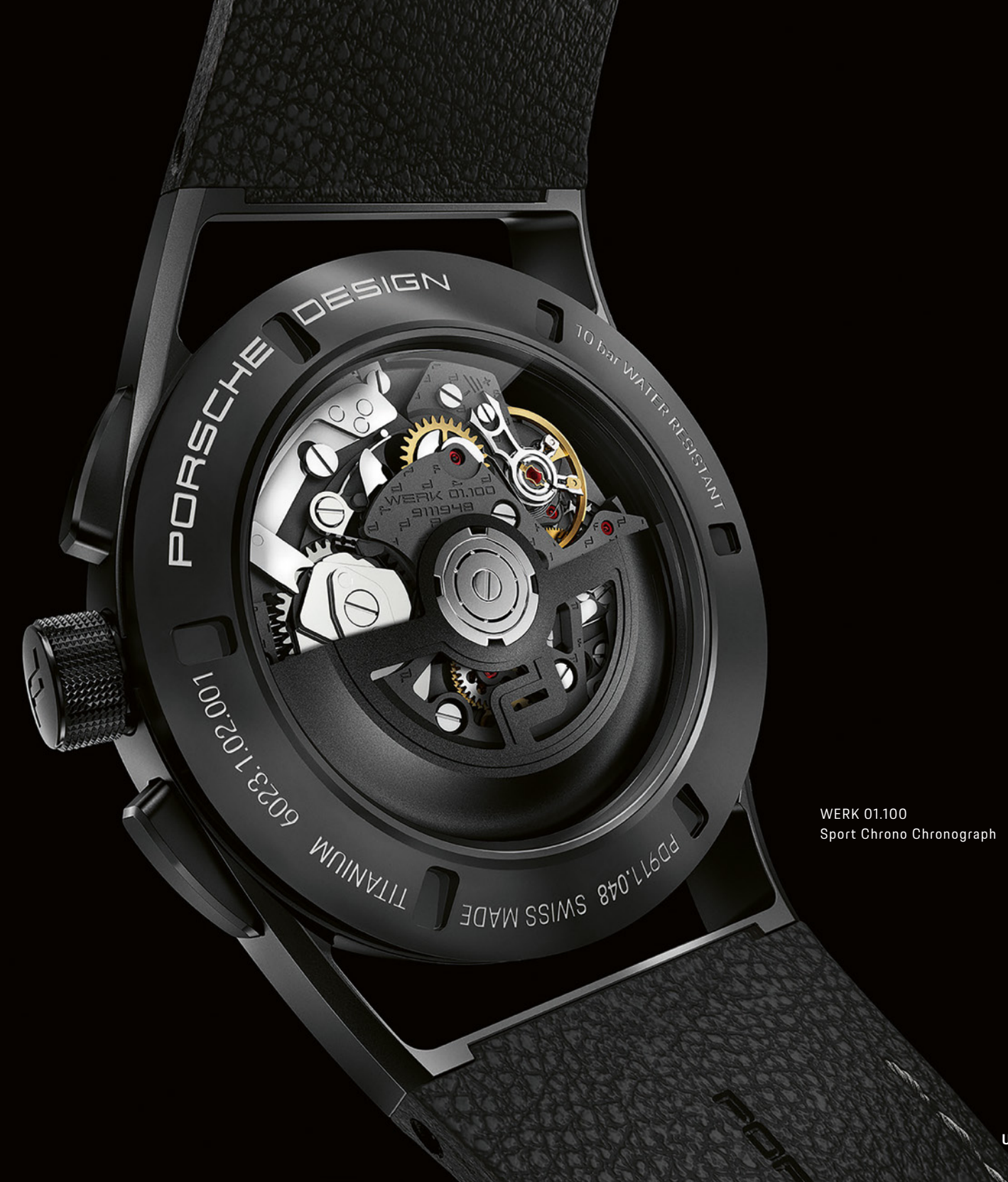
WERK 01.100 Sport Chrono Chronograph

Cette symbiose parfaite est transposée depuis 2014 dans des montres haut de gamme, au sein de la manufacture horlogère Porsche Design, la société Porsche Design Timepieces AG. Ingénieurs et horlogers y travaillent main dans la main pour extraire de chaque modèle le maximum de performances. Pour rendre chaque design un peu plus intemporel. Et pour apporter aux véhicules la qualité Porsche mais la transposer également aux montres-bracelets. Et donner ainsi à chaque seconde qui passe une nouvelle signification.